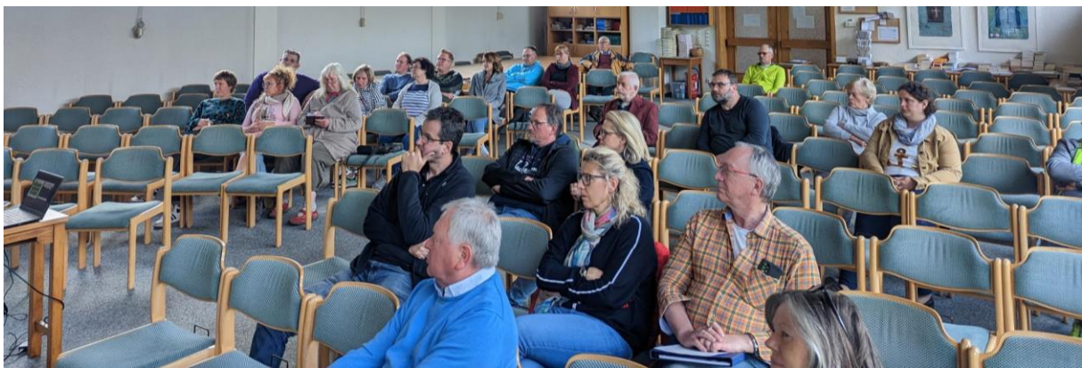
Impression der Auftaktveranstaltung

Des Weiteres informierten die Moderator:innen über die Fördermöglichkeiten für private Bauvorhaben, die ortsbildprägende Gebäude (Baujahr bis etwa 1945, ggf. auch jünger) betreffen. Besitzer:innen solcher Gebäude können sich durch die Kreisverwaltung (Ansprechpartnerin Frau Kämpf) beraten lassen und ggf. eine finanzielle Förderung für Sanierungs- und Umbauarbeiten erhalten.